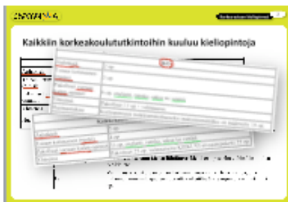
Dia 2 Kaikkiin korkeakoulututkintoihin kuuluu kieliopinnoja