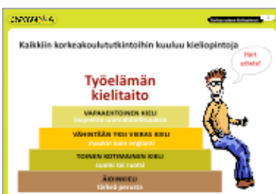
Dia 3 Työelämässä vaaditaan hyvää kielitaitoa

Kieltenopiskelu ei lopu lukioon tai ylioppilastutkintoon!