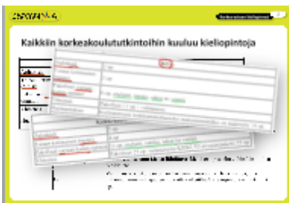
Dia 2 Kaikkiin korkeakoulututkintoihin kuuluu kieliopinnot